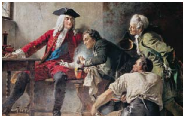
Бетгер представляет Августу Сильному тайное средство

Избранные изделия из раннего мейсенского фарфора возвращаются на место своего производства только на время юбилея и превращают тем самым заслуживающую внимания крепость в замок фарфора.