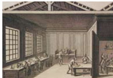
Производство фарфора в крепости Альбрехта около 1780 года