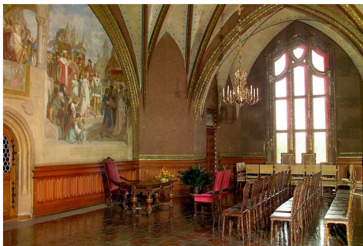
Die Kleine Tafelstube

750 EUR (inkl. Nebenkosten, zzgl. 20 EUR für Fotogenehmigung)