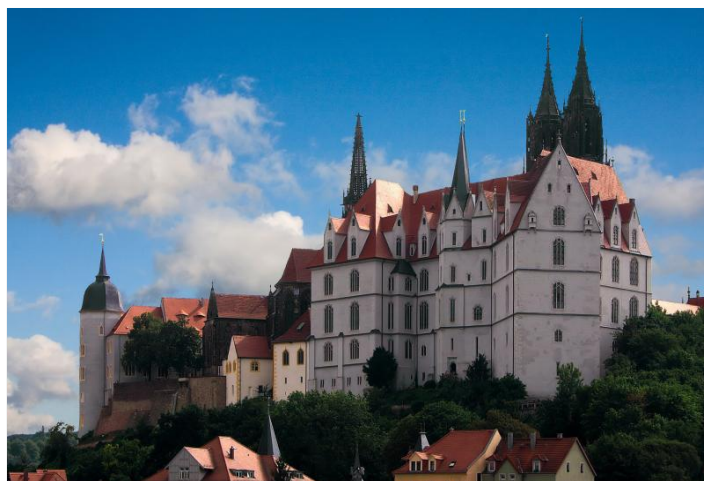
Der Meißner Burgberg mit Dom und Schloss