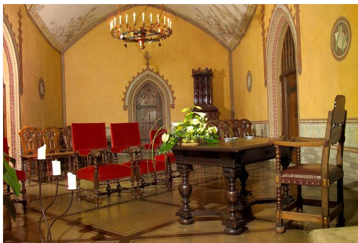
Das Kleine Gemach

620 EUR (inkl. Nebenkosten, zzgl. 20 EUR für Fotogenehmigung)