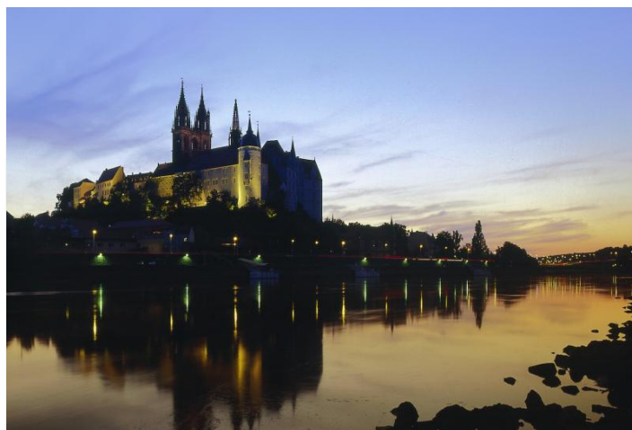
Albrechtsburg bei Nacht