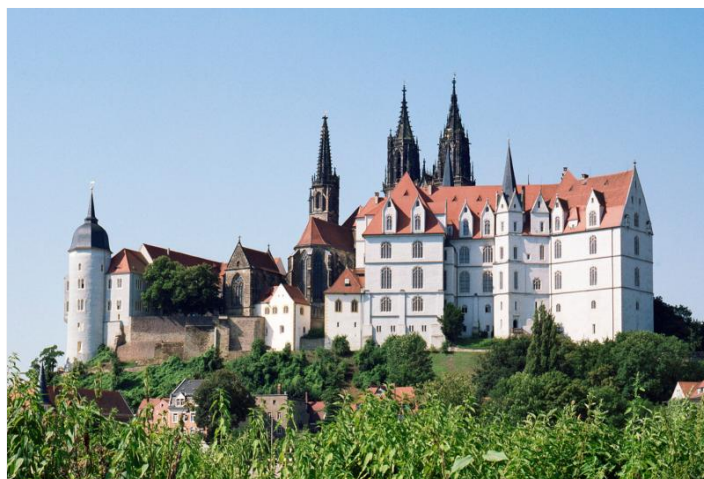
Burgberg mit Albrechtsburg Meissen und Dom