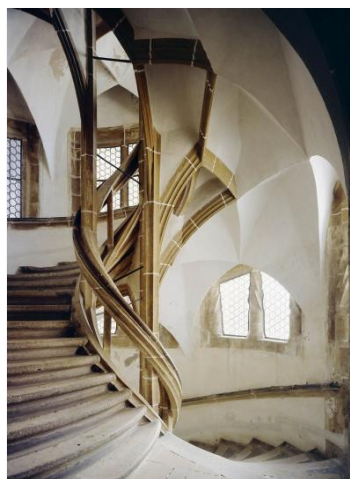
Der Große Wendelstein und die Albrechtsburg aus der Luft