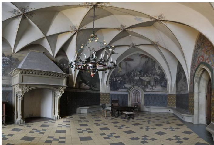
Das Kleine Kurfürstenzimmer

680 EUR (inkl. Nebenkosten, zzgl. 20 EUR für Fotogenehmigung)