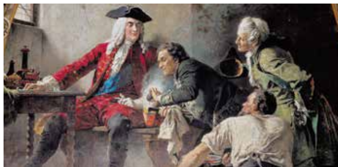
Johann Friedrich Böttger zeigt August dem Starken die Arkana, Wandgemälde von Paul Kießling

Gehen Sie mit Ihren Kindern auf Schatzsuche und schicken Sie sich ein historisches Selfie. Große und kleine Detektive können auf Spurensuche gehen und dabei viele spannende Geschichten aus längst vergangenen Zeiten des »Trendsetters seit 1471« erleben.