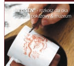
MEISSEN® - rozkosz dla oka Warsztaty pokazowe & muzeum