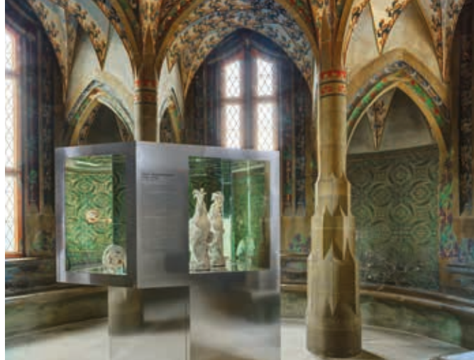
Izdebka Wieży Kaplicznej