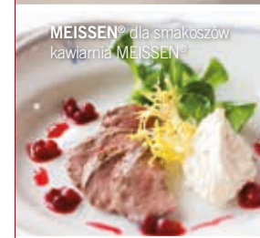
MEISSEN® dla smakoszy kawiarńia MEISSEN®