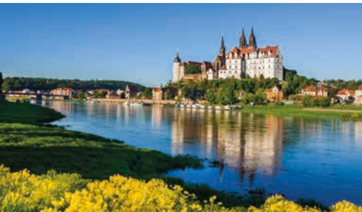
Zamek Albrechtsburg w Miśni

Wysoko nad Łabą majestatycznie wznosi się Zamek Albrechtsburg w Miśni, najstarszy zamek w Niemczech. Jego mury świadczą o władzy oraz dziedzictwie kultury byłych władcy tego kraju, margrabiów miśnieńskich.